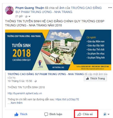
Hình 3: Ví dụ bài viết đã được chia sẻ trên trang cá nhân của người phụ trách đơn vị