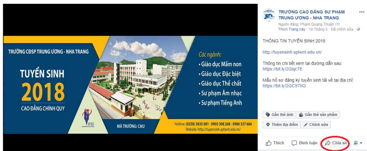
Hình 1. Ví dụ bài viết trên trang Fanpage Nhà trường Sau khi chọn bài viết, bấm Chia sẻ